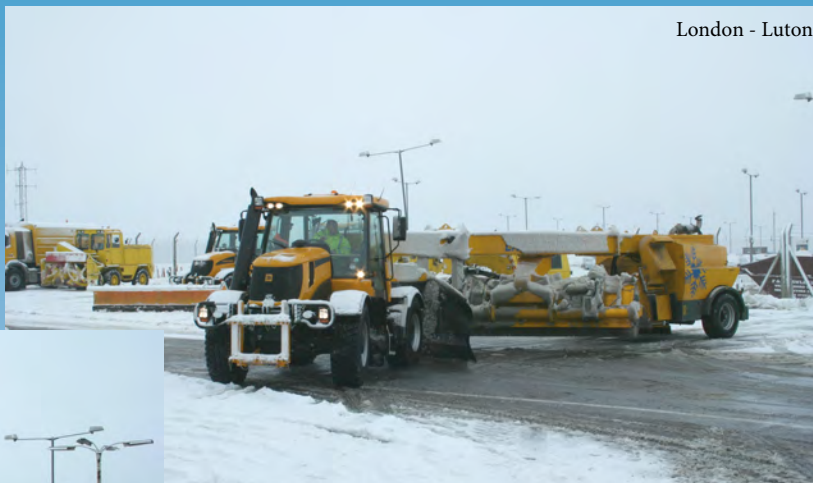
London - Luton

Grazie alle sue prestazioni di assoluta eccellenza, la Fastrac può trainare anche i complessi spazzanti e soffianti/aspiranti che sono utilizzati normalmente in ogni aeroporto per garantire un rapido ed efficiente sgombero della neve da piste di volo e raccordi.