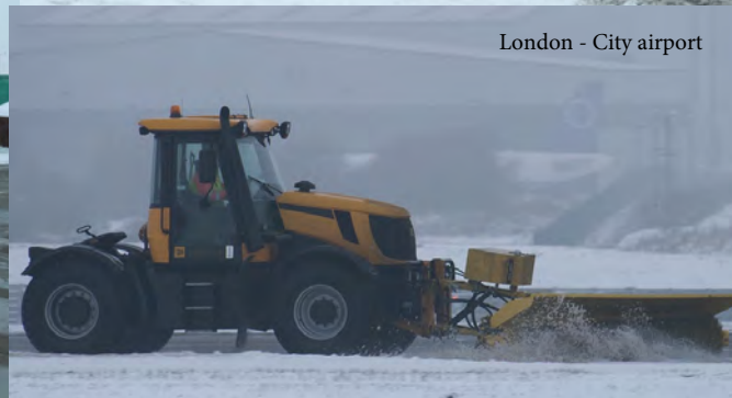
London - City airport

I complessi trainati per lo sgombero della neve azionati tramite il Fastrac JCB sono in uso in numerosi aeroporti del Nord Europa e del Regno Unito, in cui hanno dato prova delle proprie capacità e caratteristiche di potenza, durezza, elasticità e soprattutto affidabilità già da molto tempo.