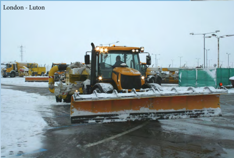
London - Luton